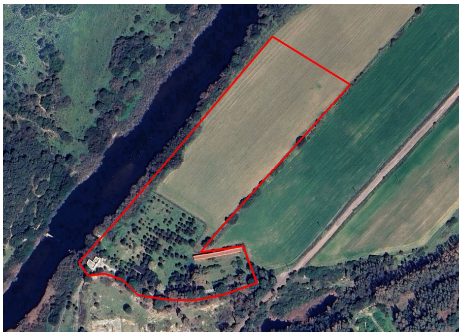
CAMPO DI GARA